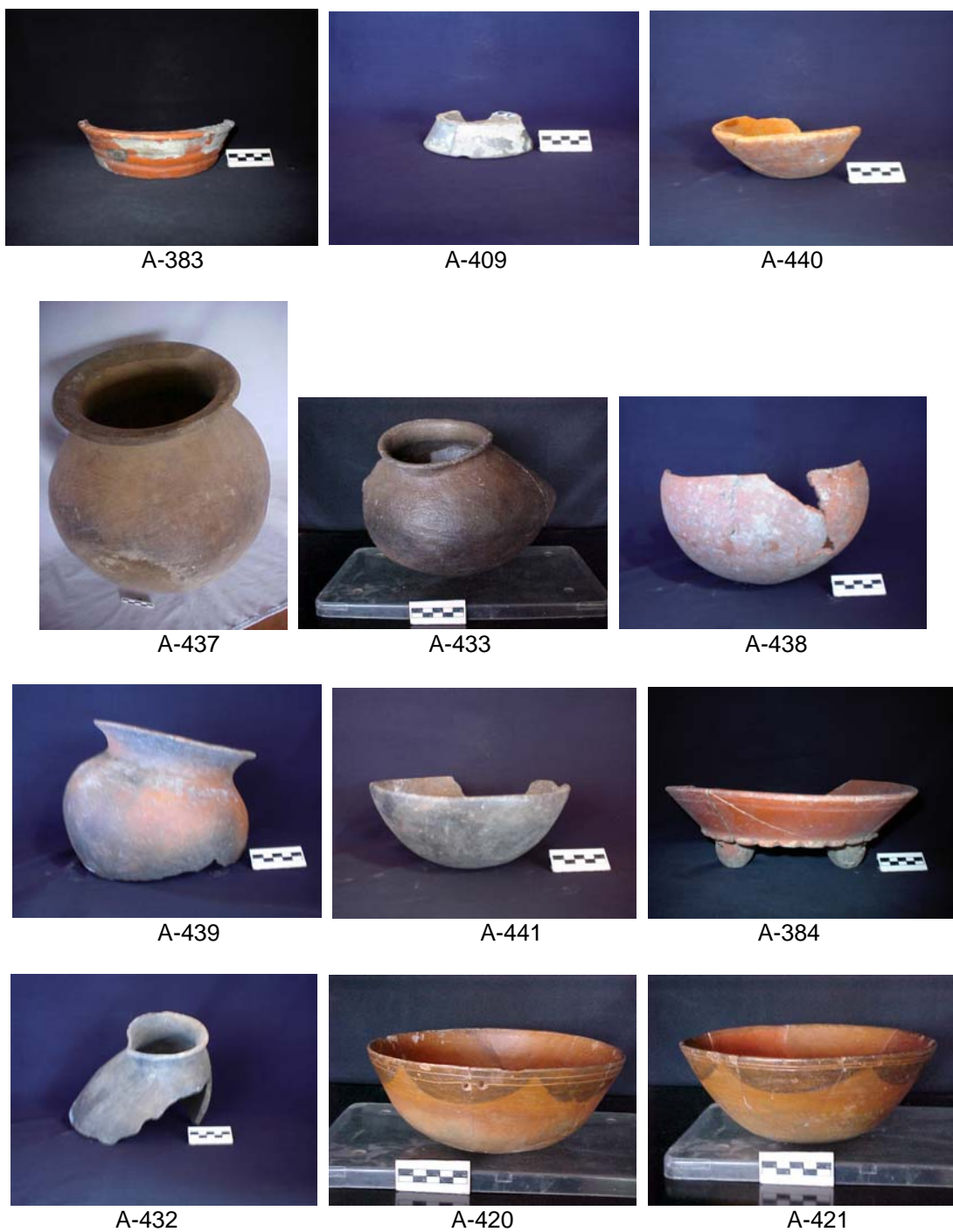
Figura 3 Vasijas localizadas dentro de la cueva Aktun Ak'Ab