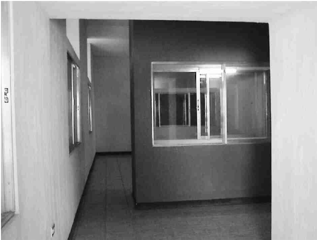
Figura 4 Vista del Museo Regional del Sureste de Petén