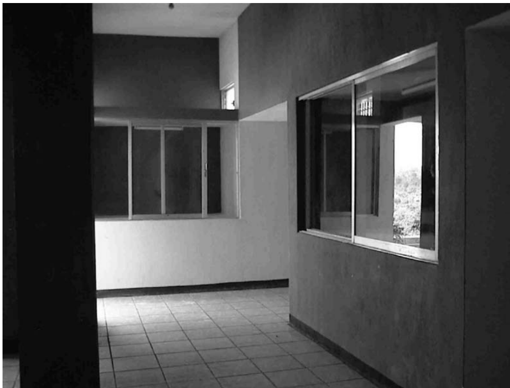
Figura 3 Vista del Museo Regional del Sureste de Petén